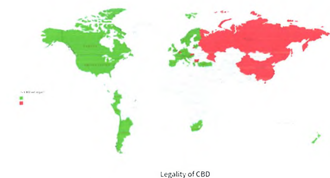
Mynd 1. Lögleiðing CBD víðsvegar um heiminn

fullnustu eða í lækningaskyni. Þar á meðal eru mörg lönd sem við viljum bera okkur saman við, svo sem Noregur, Þýskaland, Danmörk og Finnland (sjá mynd 1). 6